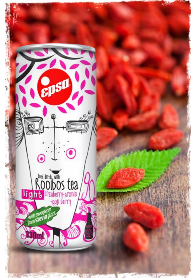
Iced drink with Rooibos Tea, Cranberry, Aronia, Goji Berry