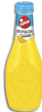
Orangeade Non carbonated