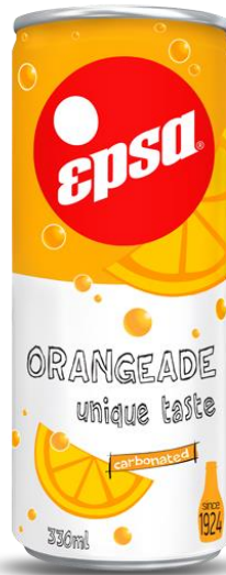
Orangeade Carbonated / Still