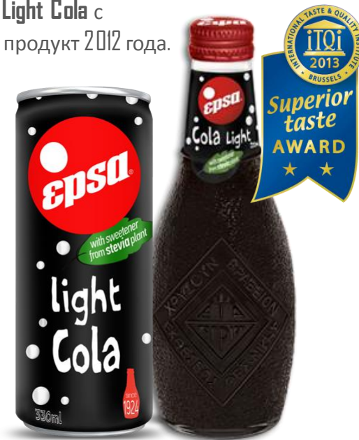
Cola Light 330 ml Slim Can 232 ml Glass Bottle