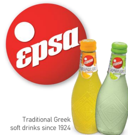
Traditional Greek soft drinks since 1924

Кроме того, с новаторскими линейками напитков BIO (на основе натурального сока и природного сахара) и продукции с подсластителем из стевии, EPSA следует последним тенденциям в сфере международных инноваций. Продукция компании нацелена на потребителей, которые заботятся о своем здоровье и о качестве потребляемых продуктов.